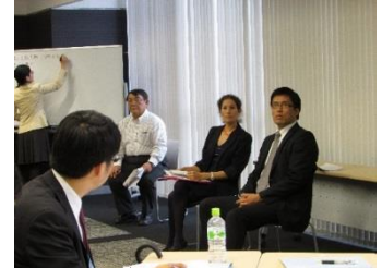
登場人物の交渉の問題点や課題を指摘したり議論。受講生は自身の理解不足などに「気づく」場面も