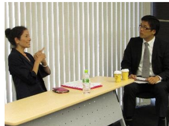
プロの俳優による交渉場面の上演。 交渉に苦戦する登場人物が、あたかも自分自身であるような感覚が芽生える

この体験を通して、交渉相手との人間関係構築や理解、判断、交渉ロジック組立のスキルを身に付ける、リアルに“感じる”体験セミナーです。