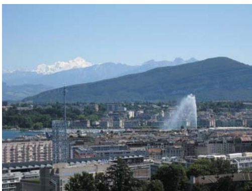
写真2. ITU最上階からモンブランを眺む