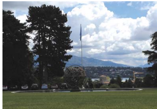
写真3. 国連欧州本部の庭

ITU会議の出席者にとって昼食は緊張を癒す大事なひとときだ。既に4月号（2013年）で紹介されたように、ITUには2箇所の食堂がある。ひとつはモンブリオンビル(Montbrillant)とヴァレンベイル (Varembé) の間の2階 (1er étage)、もうひとつは、ITUタワービルの最上階 (14階) にある。手っ取り早くそこで昼食を取るのもいいが、お昼休みが2時間取れる場合には、近くのレストランで昼食するのも一案だ。その日の会議がお昼で終了するラッキーな日にはカラフに入ったテーブルワイン (vin ouvert) と一緒に昼食を楽しむのもよい。カラフのワインは2dl、3dl、5dl、1lと必要なだけ注文できる。スイスの白ワイン (vin blanc) の代表的なぶどうの種類にはシャスラ (Chasselas)、シャルドネ (Chardonnay)、アリゴテ (Arigoté)、フォンドン (Fendant) 等があり、それぞれ異なった香り、味を楽しめる。一方、スイスの赤ワイン (vin rouge) ではピノ ノアール (Pinot Noir)、ガメ (Gamey)、メルロ (Merlot) などがある。スイスワインの主