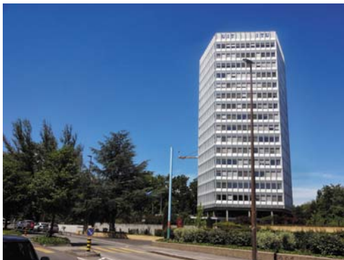
写真1. ITUタワービルディング

セルフサービスのレストラン以外は原則としてあらかじめ (例え出掛ける直前でも) 予約を取ることをお勧めする。日本のように客が回転しないので、満席となると待っていても空かないことが多いからである。土曜の昼、日曜、月曜、祭日は休業のところが多いので注意していただきたい。