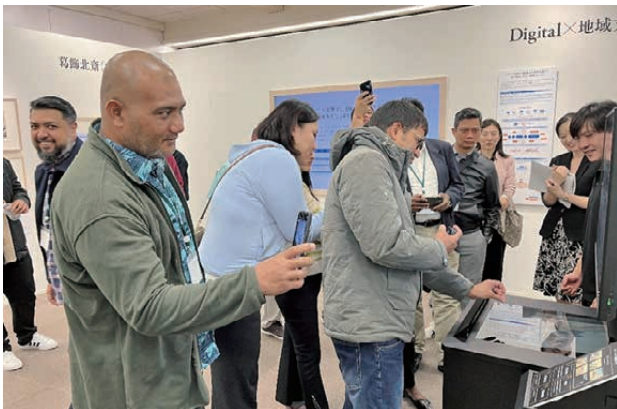
■図7. NTT e-City Laboの見学

研修で、アクションプラン作成に関して浜野講師からの解説及びアクションプランを作成するために便利なアプリケーションについて説明があった。研修生は、自国の過疎地域を選択し、人口、地形、利用可能な設備などの具体的な項目を考慮して、デジタルデバイドの解消に向けた最適なネットワークプランを検討し、資料としてまとめた。