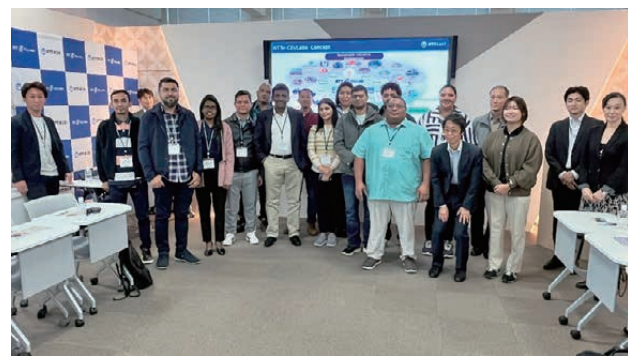
■図6. NTT e-City Labo訪問での集合写真

農業)、270°裸眼VRシアタ、ローカル5Gオープンラボ、vLab(ニュー・ラボ)、スマート製造・物流、超小型バイオガスプラント、自動運転バス、遠隔営農実証ハウススマートハウスについて見学し、地域循環型社会の実現に向けたソリューションについて学んだ(図7)。その後、関東屈指の古刹として知られている深大寺を訪問し、観光ボランティアガイドによる深大寺に関するガイドツアーを体験し、日本文化について学んだ。