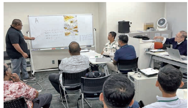
■図5. ドリルを用いたグループディスカッション後の発表