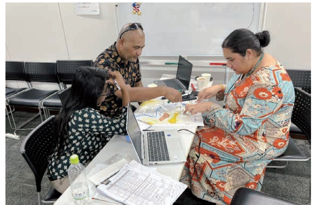
■図4. ドリルを用いたグループディスカッション

5日目は、日本の先端技術研究施設の視察のため、NTT中央研修センター内にある、NTT e-City Laboを訪問した(図6)。NTT e-City Laboでは、NTT東日本グループが現在取り組んでいる、地域の課題解決に向けたソリューションのうち、Digitalアート、ドローン×インフラ点検(災害対策、