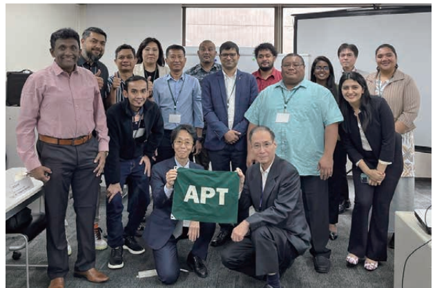
■図9. 終了セレモニーでの集合写真

の活性化を図った。特に研修生は日本のお菓子にとっても興味を持った。グループディスカッションでは、課題の地形についての議論がしやすいように、グループごとに地図を取り囲むように着席できる机のレイアウトに変更し、議論の活性化を図った。また、グループのメンバーを入れ替えながら複数回議論することで、いろいろな意見を聞きながらネットワークプランの検討を進め、より完成度の高いネットワークプランの作成を図った。各グループの代表者が、その日の最適ネットワークプランを発表するが、なるべく全員が発表の機会を得られるよう配慮した。このような取組みの結果、最終日のアクションプランで、すべての研修生からアクションプランの報告が得られた。