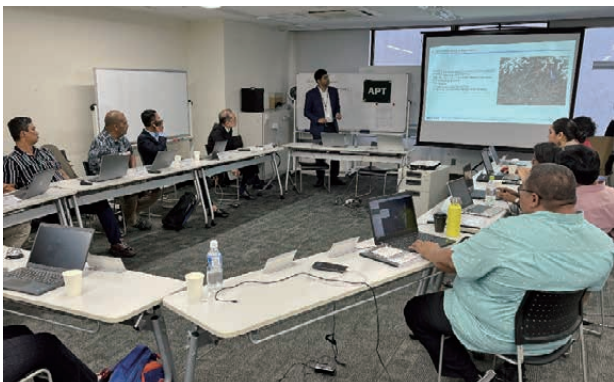
■図8. アクションプランの発表

昨年同様、研修室へドリンクとお菓子のケータリングを行い、研修生同士または講師や事務局とのコミュニケーション