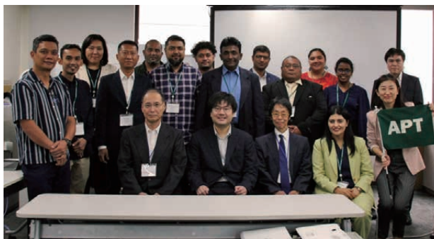
■図1. オープニングセレモニーでの集合写真

研修初日の午前は、研修に関するガイダンス、オリエンテーションを行った。オリエンテーションでは、研修についてのスケジュールと新宿周辺のガイドを実施した。午後は、研修のオープニングセレモニーが開催され総務省の青野 海豊氏より研修開始の挨拶をいただいた(図1)。その後、研修生への事前課題として作成されたカントリーレポートの発表が行われた(図2)。研修生からは、各国の概要、ICT設備の普及状況などの各国の現状、アクションプランで選択し