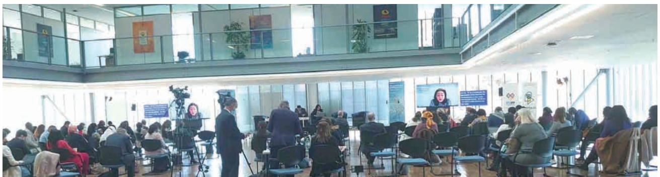
■ 図1. ITU本部モンブリオンビルでの開催の様子

標準化活動では、グローバルな市場・技術動向の理解に加え、言語、交渉、戦略、コミュニケーション、リーダー