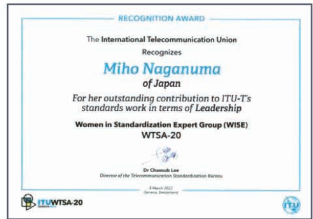
■図2. リーダーシップ賞

標準化活動を始めて約20年、様々な意味で環境が大きく変わっていると感じることは多い。中でも、ジェンダー観点は、この5～6年、非常にクローズアップされており、私自身も今まで意識しなかった側面からITUに貢献できる機会も増えている。グローバルでも、女性の参加者やリーダーはまだ少ないことは事実ではあるが、女性全体の参加者数は着実に増えている*3。これを好機と捉え、ジェンダー格差是正への動きを加速すること、そしてジェンダー格差のない標準化活動が当然となる時代が来ることを期待したい。