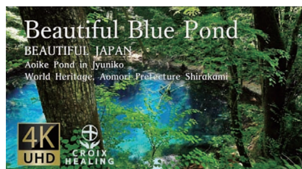
■CROIX HEALING | 世界遺産白神山地 | 青池 YouTube公開中→ https://youtu.be/FY6cRT1Y-7U

美しい自然映像を資料映像として展示していた事もあり、世界各地の皆様にご視聴いただけたと思う。