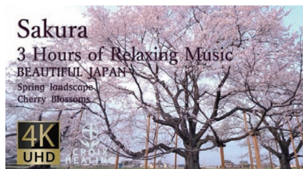
■CROIX HEALING | Sakura | 栃木県・淡墨桜 YouTube公開中→URL https://youtu.be/_CrdmAuqHbU

リアルなブース展示でも映像をご視聴いただく事は可能であるが、今回はバーチャル展示による視聴環境のため、より没入感を感じていただけた事も当社として大きなメリットとなり、今後のWEB3.0時代に向けたグローバル展開における重要なキーポイントになる事を実感した。