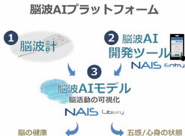
■図2. 脳波AIプラットフォームの3つの要素

状態をラベルされた脳波を数多く収集することで、ヒトの活動や心身の状態と脳波との結び付きを理解することができる。また、このような脳波AIを数多く開発すれば、脳波を計測することで、様々なヒトの心身の状態を客観的に理解することができるようになる。