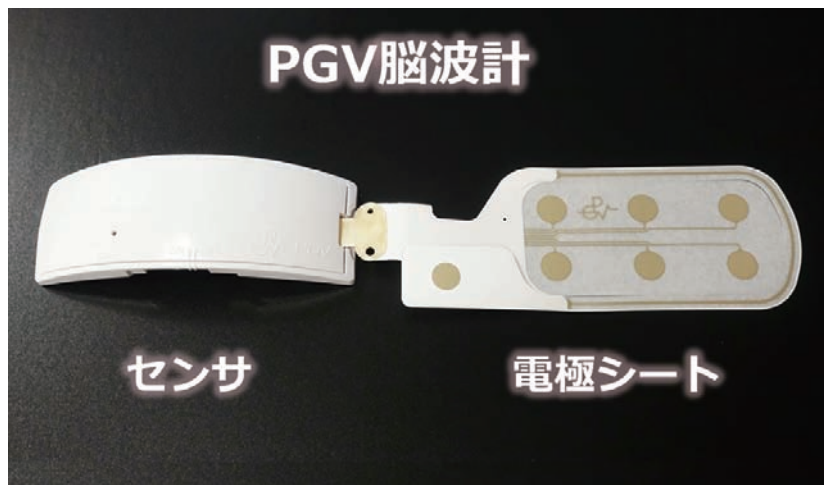
■図1. PGVのパッチ式脳波計