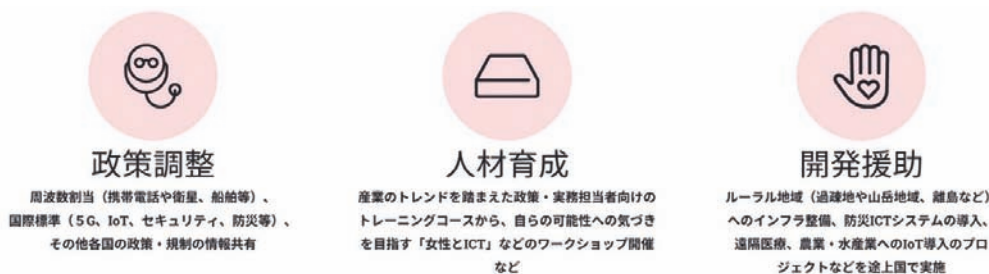
■図1. APT活動の分野による分類 (国際公共政策の三位一体活動)

上記を踏まえた上で、現在行っているAPT活動全体を眺めると、図3「APT活動の全体像」のようになります。