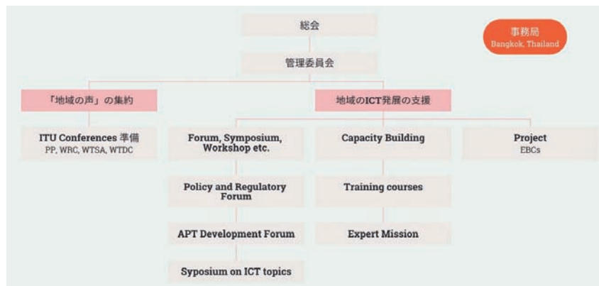
■図2. APT活動の機能による分類