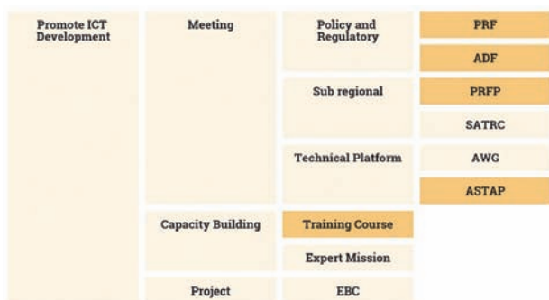
■図4. Promote ICT Development Structure

2つめの活動 (Work Programme) については、既存の Work Programmeの見直し・充実 (図4) と新規活動へのチャレンジです (図5、6)。図4で示している (色を強調している) 既存のWork Programmeは、目的の再構築といった内容面や成果主導型 (output oriented) への転換といった運営面などでまだまだ改善の余地があり、参加されている方々からも様々なアイデアをいただいたりするので、それらを実践していくことで一層の充実を図っていきます。