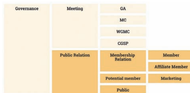
■図6. Governance Activity

図5は、今後新規に着手していきたい活動分野を示しています (色を強調している部分)。その詳細はメンバーの方々の意見を反映させながら企画案を精査していくこととなりますが、既に少しずつプレストしたり、関係者からのヒアリングをしたりしながら案を練っているところです。なお、この場を利用して今後のプランとしてお話ししたいのが、図6の広報 (Public Relation) の部分です。これまでのAPTは、広報 (対メンバー、対パブリック) という面では非常に脆弱であり、加盟国・メンバー各社様とのコミュニケーションには改善の余地が大いにあり、またメンバーの立場からすれば、APTの会合に出席する以上の関係性が構築できていた