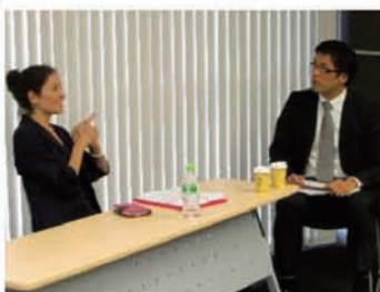
プロの俳優による交渉場面の上演。交渉に苦戦する登場人物が、あたかも自分自身であるような感覚が芽生える

この体験を通して、交渉相手との人間関係構築や理解、判断、交渉ロジック組立のスキルを身に付ける、リアルに“感じる”体験セミナーです。