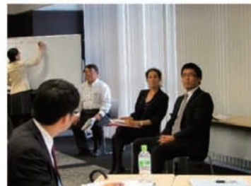
登場人物の交渉の問題点や課題を指摘したり議論。受講生は自身の理解不足などに「気づく」場面も

※交渉部分は英語で行われますが参加者同士のディスカッション等は日本語で行います。