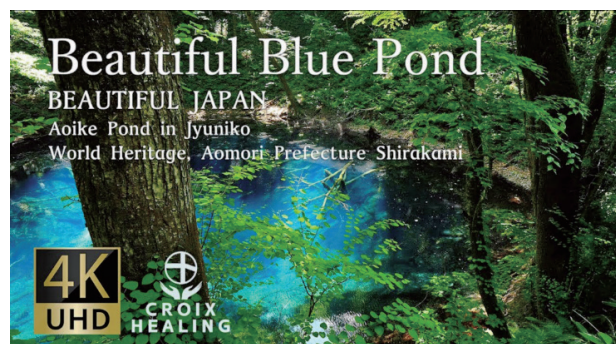
■CROIX HEALING | 世界遺産白神山地 | 青池 YouTube公開中→ https://youtu.be/FY6cRT1Y-7U

美しい自然映像を資料映像として展示していた事もあり、世界各地の皆様にご視聴いただけたと思う。