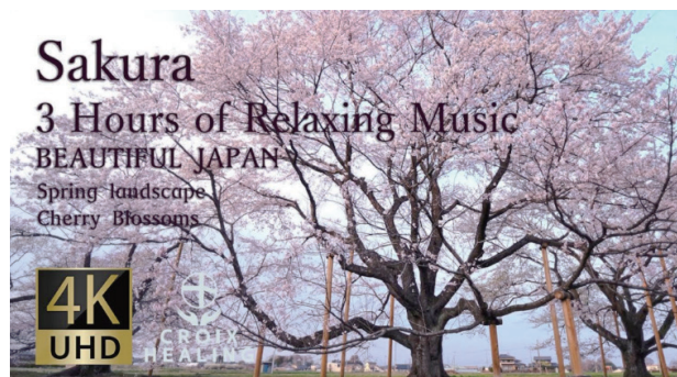
■CROIX HEALING | Sakura | 栃木県・淡墨桜 YouTube公開中→URL https://youtu.be/_CrdmAuqHbU

リアルなブース展示でも映像をご視聴いただく事は可能であるが、今回はバーチャル展示による視聴環境のため、より没入感を感じていただけた事も当社として大きなメリットとなり、今後のWEB3.0時代に向けたグローバル展開における重要なキーポイントになる事を実感した。